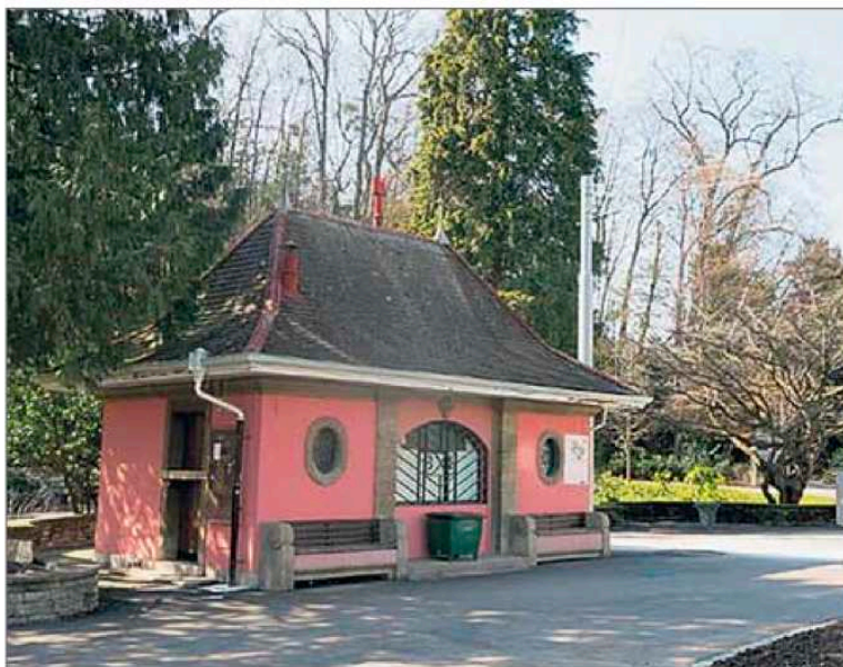
Les WC publics Fraisse-Kiosque constituent l'un des trois nouveaux édicules concernés.

Au cœur de l'été, fort de ce succès, trois autres édicules lausannois étaient proposés à d'éventuels «repreneurs»: le WC public du giratoire de Fraisse, près du parc de Milan, ceux du Calvaire, vers le CHUV, et de l'abribus TL du pont de Chailly. Seulement voilà, dans les quartiers concernés, on ne